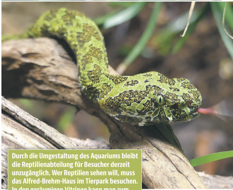
Durch die Umgestaltung des Aquariums bleibt die Reptilienabteilung für Besucher derzeit unzugänglich. Wer Reptilien sehen will, muss das Alfred-Brehm-Haus im Tierpark besuchen. In den geräumigen Vitrinen kann man zum Beispiel die farbenprächige Mangshan-Grubenotter und die Zhous Scharnierschildkröte beobachten. Beide sind in freier Natur sehr selten und vom Aussterben bedroht.