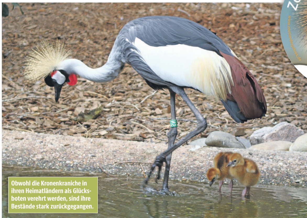
Obwohl die Kronenkraniche in ihren Heimatländern als Glücksboten verehrt werden, sind ihre Bestände stark zurückgegangen.

Schutzprojekt in Tansania: Tansania war einst Heimat von Zehntausenden Kronenkranichen. Heute sind nur noch wenige tausend Tiere übrig. In Zusammenarbeit mit lokalen Gemeinden, Schulen und Freiwilligen soll daran gearbeitet werden, den Kranichen eine Zukunft zu sichern. Ziel ist es, die Feuchtgebiete und Brutplätze durch Baumpflanzungen, Abgrenzungen und