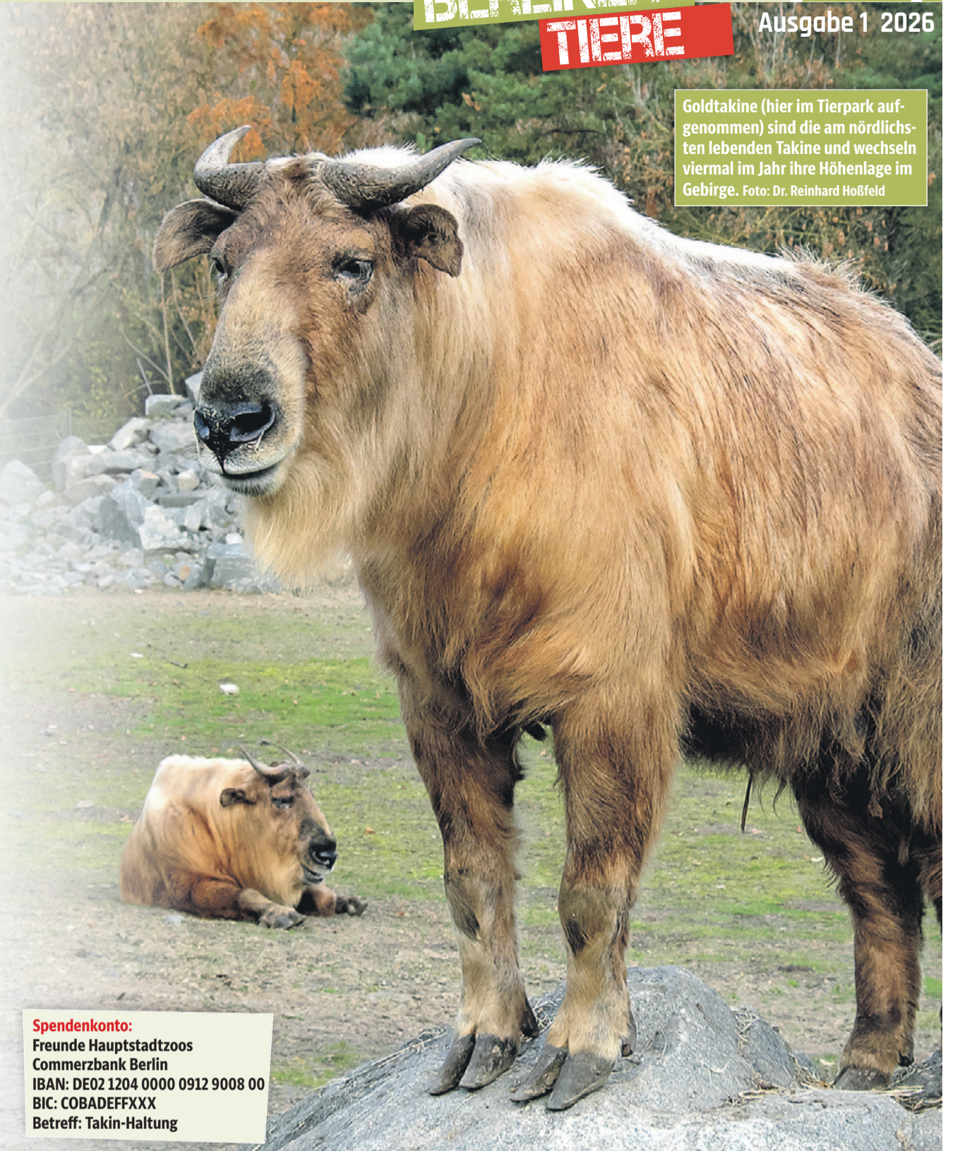
Goldtakine (hier im Tierpark aufgenommen) sind die am nördlichsten lebenden Takine und wechseln viermal im Jahr ihre Höhenlage im Gebirge.

Trotz der Legenden und dem Status als heiliges Tier konnte es nicht verhindert werden, dass die Bestände im natürlichen Lebensraum in den letzten Jahren um 30 Prozent zurückgegangen sind. Daher werden Takine als vom Aussterben bedroht eingestuft. Die Takine in Berlin haben somit eine große Aufgabe, nicht nur für Nachwuchs sorgen, sondern auch das Bewusstsein für die Bedrohung dieser besonderen Tiere zu wecken. Damit werden die Berliner Takine Botschafter, um für deren Schutz zu werben. Als Wappentier des Fördervereins möchte dieser anlässlich des 70. Vereinsjubiläums einen besonderen Beitrag für die Haltung dieser lebenden Fabelwesen leisten und sammelt Spenden für die Haltung in den Hauptstadtzooen.