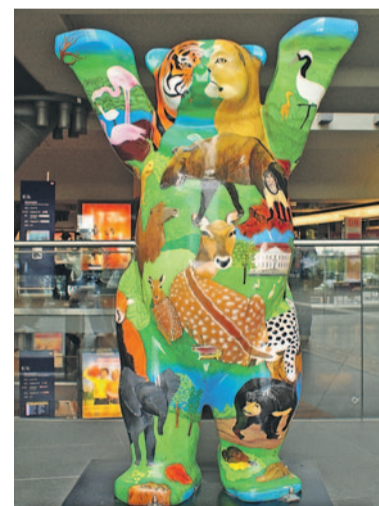
Zum 50. Jubiläum des Fördervereins wird 2006 ein von einer afrikanischen Künstlerin gestalteter Buddy-Bär am Hauptbahnhof aufgestellt, wo er seit diesem Zeitpunkt seinen Standort hat.

Trotz sinkender Mitgliederzahlen finanziert der Förderverein jährliche Spendenprojekte im Tierpark. So konnten von 1994 bis 2000 neue Anlagen für 723.000 DM finanziert werden. Mit einer Summe von 369.000 Euro finanziert die Fördergemein-