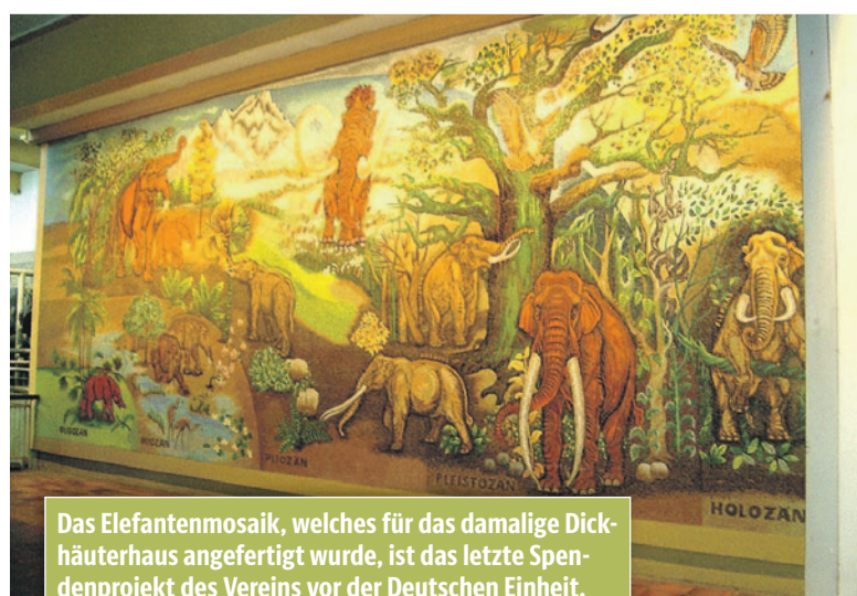
Das Elefantenmosaik, welches für das damalige Dickhäuterhaus angefertigt wurde, ist das letzte Spendenprojekt des Vereins vor der Deutschen Einheit.

2026, das Jubiläumsjahr des Fördervereins, hält nicht weniger Herausforderungen bereit. Steigende Kosten für Energie, Lebensmittel und Investitionen machen nicht nur vielen Menschen zu schaffen, sie haben auch erhebliche Auswirkungen auf die Hauptstadtzoos. Gerade in diesen herausfordernden Zeiten sind die Unterstützung und die Solidarität der vielen Menschen, denen der Zoo und der Tierpark Berlin ein Herzensanliegen ist, wichtig.