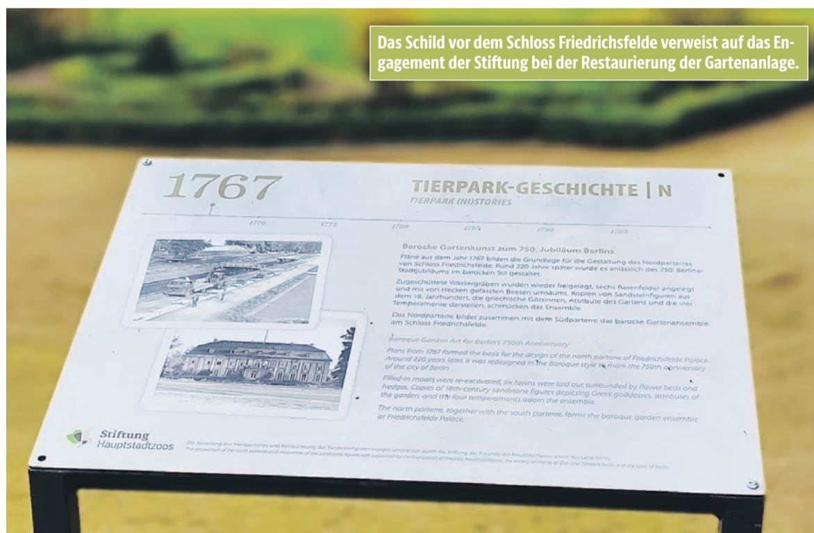
Das Schild vor dem Schloss Friedrichsfelde verweist auf das Engagement der Stiftung bei der Restaurierung der Gartenanlage.

Die Restaurierung der Gartenterrassen wurde durch die Stiftung Hauptstadttzoos bereits finanziert. Nunmehr soll die vorangeschrittene Restaurierung der Sandsteinfiguren in diesem Jahr abgeschlossen werden. Witterungseinflüsse, mechanische Beanspruchungen, aber auch der saure Regen machten den Skulpturen stark zu schaffen. Durch die restauratorischen Maßnahmen sollen die Figuren auch für kommende