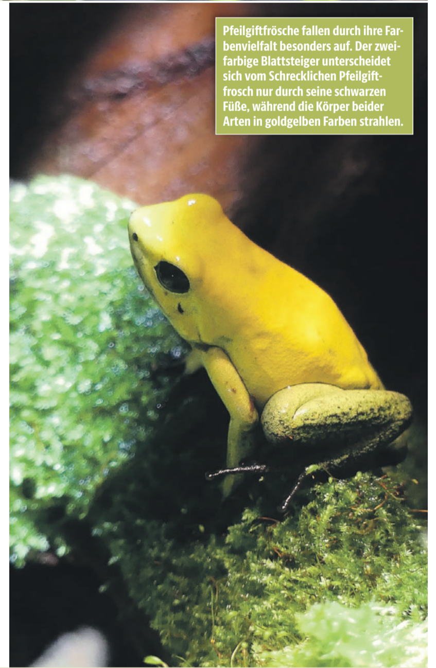
Pfeilgiftfrösche fallen durch ihre Farbvielfalt besonders auf. Der zweifarbige Blattsteiger unterscheidet sich vom Schrecklichen Pfeilgiftfrosch nur durch seine schwarzen Füße, während die Körper beider Arten in goldgelben Farben strahlen.

Die Insektenabteilung im Dachgeschoss bietet eine Vielzahl von besonderen Tieren, so zum Beispiel die Riesensblattschrecke (großes Foto oben). Sie gehört zu den größten Heuschreckenarten. Die Weibchen erreichen eine Länge von bis zu 13 cm, während die Männchen etwas kleiner bleiben. Ihre Flügelspannweite kann beeindruckende 25 cm betragen, dennoch sind sie keine guten Flieger. Meist bewegen sie sich krabbelnd fort und das auch eher selten, denn sie sind perfekt getarnt. Die Flügel der ausgewachsenen Tiere ähneln Laubblättern so täuschend echt, dass sie sich trotz ihrer beachtlichen Größe nahezu unsichtbar in der Vegetation verstecken können. Obwohl Riesensblattschrecken keine Ohren am Kopf haben, wie wir es von Säugetieren kennen, besitzen sie dennoch Hörorgane, die denen des Menschen ähnlich sind. Ihre Trommelfelle befinden sich jedoch nicht am Kopf, sondern an den Vorderbeinen. Mit diesen können sie Geräusche aus der Ferne wahrnehmen, um potenzielle Feinde frühzeitig zu erkennen. Bei den weiblichen Tieren kann am hinteren Körperende eine Art Stachel zu sehen sein, der sogenannte Ovipositor. Mit ihm legen die Weibchen ihre Eier direkt in den Boden. Nach etwa zwei bis drei Monaten schlüpfen die Nymphen (Jungtiere) und zeigen ein bemerkenswertes Verhalten. Bis zur Häutung zum erwachsenen Tier können sie ihre Kotbällchen mithilfe ihrer Sprungbeine meterweit wegschleudern. Auf diese Weise verhindern sie, dass Fressfeinde sie trotz ihrer Tarnung durch den Geruch aufspüren.