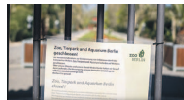
Auch in Krisenzeiten, wie hier während der Schließung aufgrund der Corona-Pandemie, steht der Förderverein der Hauptstadtzoos an der Seite der beiden zoologischen Einrichtungen.

ser Dachorganisation, die seit 2017 auf alle europäischen Zoo-Fördervereine erweitert ist, über 75 Vereine aus fünf europäischen Ländern mit mehr als 140.000 Mitgliedern vereint.