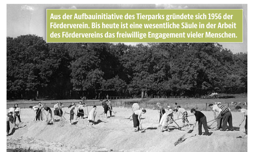
Aus der Aufbauinitiative des Tierparks gründete sich 1956 der Förderverein. Bis heute ist eine wesentliche Säule in der Arbeit des Fördervereins das freiwillige Engagement vieler Menschen.

von einem Direktor geführt. Dies nimmt der Förderverein zum Anlass, um am 13. Februar 2007 auf der Mitgliederversammlung seine Satzung zu ändern, um zukünftig auch den Zoo und dessen Aquarium zu fördern. Der Verein gibt sich den Namen „Gemeinschaft der Förderer von Tierpark Berlin und Zoo Berlin e.V.“. Dem Förderverein ging es von der Gründung an immer um die Förderung des zoologischen Gedankens. Mit der stärkeren unternehmerischen